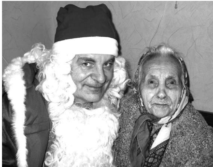
Ypatinga linksmybė – 99 kartą švenčiant Kalėdas aplankė Kalėdų senelis su palyda.