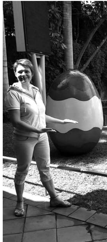
Tenerifės margučiai kiek didesni nei lietuviški.

džių. Taip pat nemažai ir uolingos pakrantės bei bangų nuotraukų, nes K. Indriūnas žinomas ir kaip mėgstantis pastovėti ant banglentės.